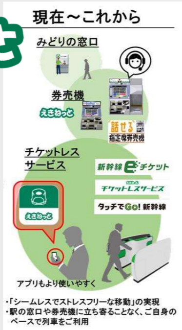
JR東日本管内の みどりの窓口の数