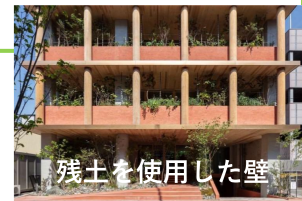
残土を使用した壁