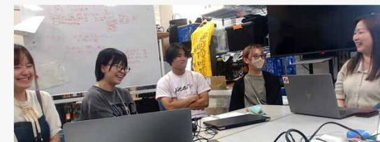
大林組に勤務している本校の卒業生